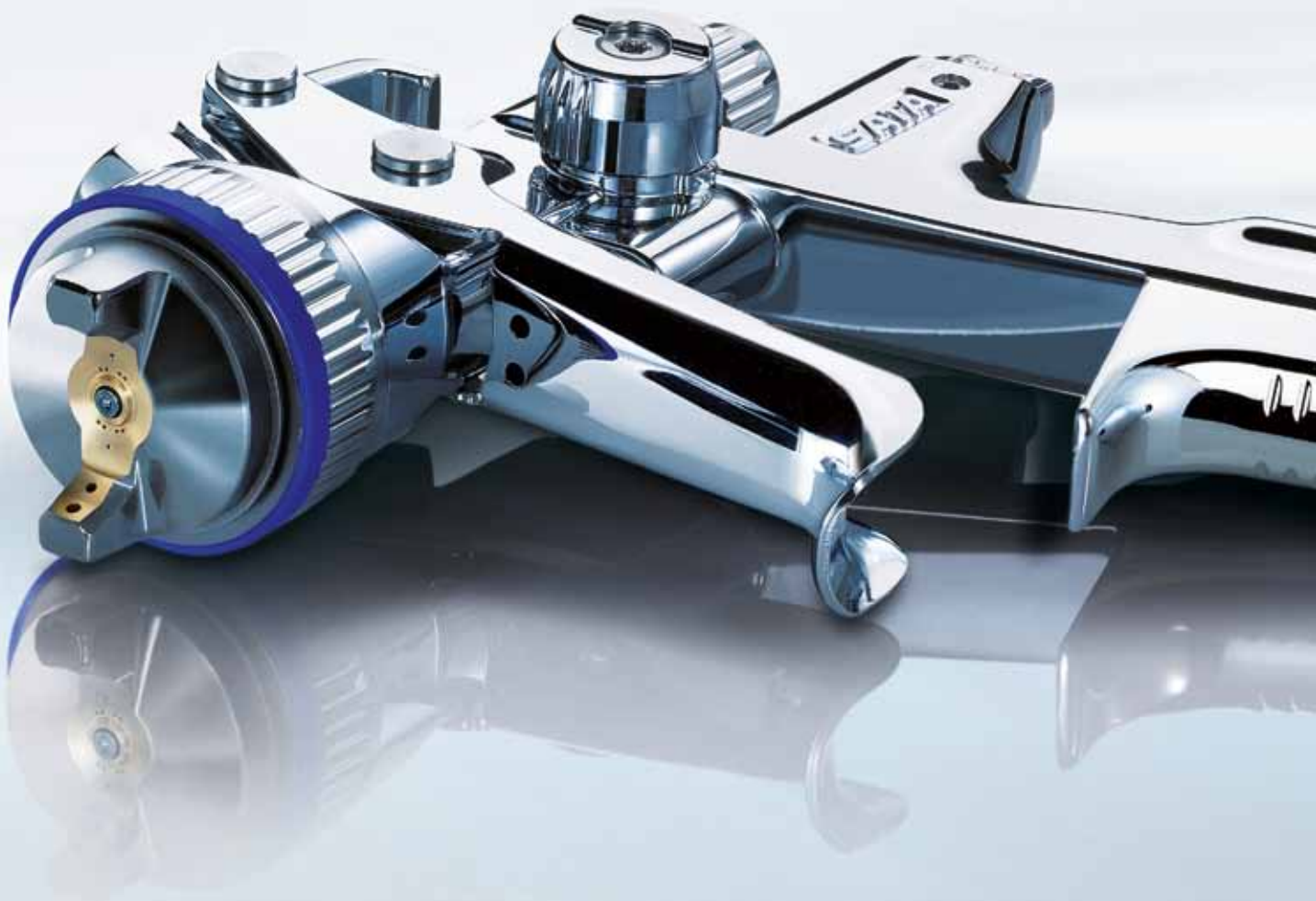
Den Druck im Griff – die DIGITAL® Option: Integrierte Druckmessung und -einstellung – wichtig für die exakte Farbtongenaugigkeit.